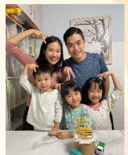
聯絡： 潘詠彤、 潘啟天家長